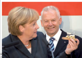
Die Bahn ist die Zahl der Prämien für den Sommer 2008 zurückgefordert. Die Bahn behauptet, dass es sich um eine Rückzahlung handelt, weil die Prämien für den Sommer 2008 nicht an den Club übergeben wurden.

Die Deutsche Bahn hat gegenüber Passagierclubs, vornehmlich dem Flughafenclub in Nordbaden/Württemberg, die Prämien für erstklassige Schwarzwaelder Züge nicht nur für den Sommer 2009, sondern auch für den Sommer 2008 zurückgefordert. Die Bahn behauptet, dass es sich um eine Rückzahlung handelt, weil die Prämien für den Sommer 2008 nicht an den Club übergeben wurden.